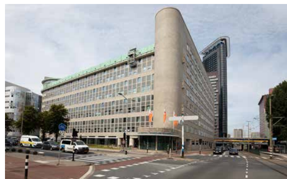
Het ruim 80 jaar oude rijksmonument is getransformeerd tot state-of-the-art kantoorgebouw.

Het is nu ruim twee jaar geleden dat SENS real estate en LIFE-NL het ontwikkelplan voor het Stationspostgebouw opstelden. Inmiddels is er veel gebeurd. Eind 2019 startten de sloopwerkzaamheden, gevolgd door de opbouw van het casco, de installaties en de afbouw. Zijlstra: "Het afwerkingsniveau is zeer hoog. Op de begane grond ligt bijvoorbeeld een prachtige terrazzo vloer, die doorloopt in de ronde balie. De verdiepingen bouwen we om tot open kantoorruimten in combinatie met rustige werkplekken. Tot de eyecatchers behoort ook zeker de bovenste verdieping, met lichtstraten die wij heropend hebben en een fraaie skylounge met uitzicht over de binnenstad." Smit voegt toe: "Met dit gebouw zetten we de toon voor de kwaliteitsimpuls die we het HS Kwartier willen geven. Over vijf jaar is de omgeving rond Hollands Spoor veranderd van passeergebied voor studenten tot een aangenaam verblijfsgebied voor iedereen die hier woont, werkt of op bezoek is." ■