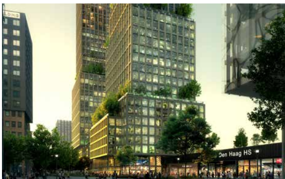
Een nieuw stuk stad direct naast het station Hollands Spoor.

De transformatie van het ruim tachtig jaar oude rijksmonument is een ontwikkeling van LIFE-NL die hierin de samenwerking zocht met de Haagse ontwikkelaar SENS real estate. KCAP Architecten maakte het ontwerp, Kraaijvanger Architects het interieurontwerp. De opdracht voor de bouwkundige uitvoering werd gegund aan aannemerscombinatie JP van Eesteren – BESIX. Het installatietechnische deel is uitgevoerd door Unica. Op 31 mei jl. droegen SENS real estate en LIFE-NL het gebouw over aan koper Perial Asset Management en de beide huurders: PostNL en het co-working concept StationPostOffices.