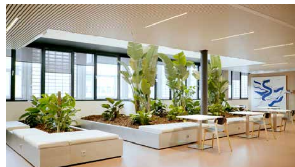
Inspirerende inrichting en interieur.

technologie. Gezondheid, vitaliteit en welzijn staan hier centraal. Niet alleen in de gebouwen, maar juist ook in de openbare ruimte. Met een rijkdo aan groen en uitnodigende plinten met onder meer horeca wordt HS Kwartier een aantrekkelijke plek om te wonen, werken en recreëren."